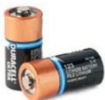
Zoll AED bruker ordinære husholdningsbatterier