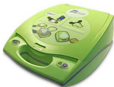
Zoll AED Plus har vannavstøtende konstruksjon