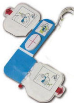
Standard elektrode med kompresjons-tilbakemelding